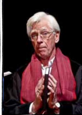
Gesetzesbruch vor Wortbruch