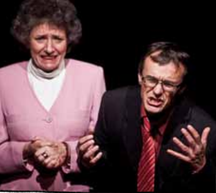
Gerechtigkeitsbarriere vor der Karriere