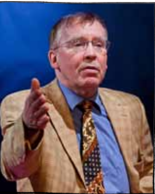
Das muss ich zu dritt entscheiden!