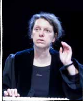
Jeder Fall bekommt die Zeit, die er braucht für Gerechtigkeit