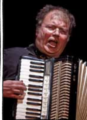
Nieder mit Justiz!

Welches Richterbild auch immer Sie als Jurist oder normaler Mensch haben, im Richterkabarett wird es Ihnen ausgetrieben. Dennoch vermittelt sich Ihnen die Welt der Justiz, aber auch die restliche Welt aus der Sicht von Richterinnen, Richtern und Staatsanwälten der Neuen Richtervereinigung. Allerdings nicht durch gestelzte Manifeste und trockene Vorträge, sondern durch satirische und musikalische Schlaglichter. Und dass diese Eigenprodukte verständlicher ankommen als Urteile und Anklagen, gewährleistet als Sachverständige eine Theaterregisseurin.