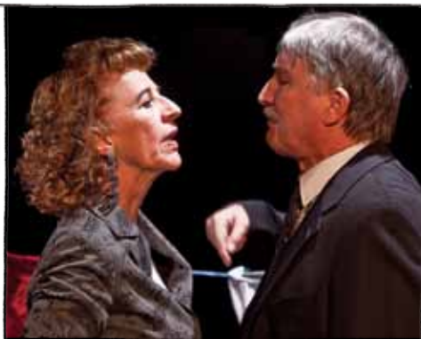
Wollen Sie geschieden werden, drücken Sie bitte die „1“!