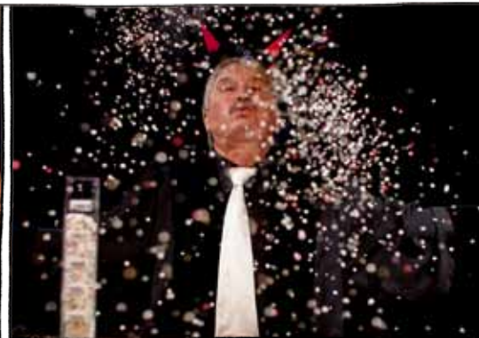
Worin du den andern richtest, richtest du dich selbst!